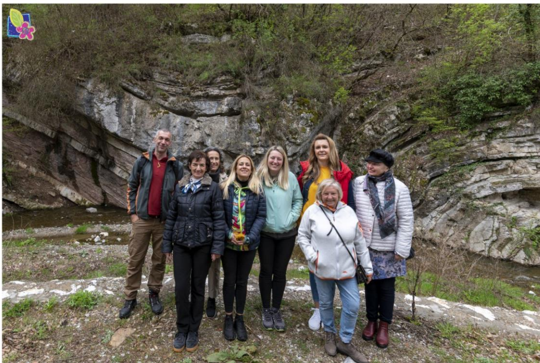
Студијско путовање “Ђердап 2022.”

У студијском путовању и посети НП “Ђердап“ и првом геопарку у Србији су учествовали представници: Секретаријата за заштиту животне средине, Завода за заштиту природе Србије, као и чланови и сарадници Удружења „Еколошки покрет Земун“.