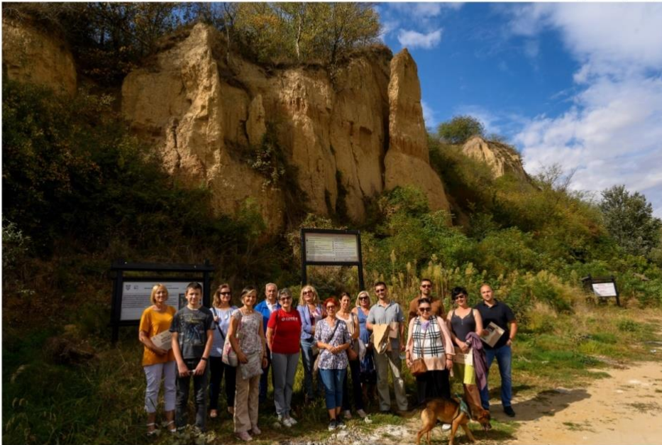
Радионица Еколошког покрета Земун: "Трагови ледених доба" 25.9.2020.

Значај лесног профила Капела је познат у научним круговима, док шира јавност такорећи и не зна ништа о лесним профилима Београда, тако да ће ове мале радионице допринети новим сазнањима о значају лесних профила како у Србији тако и у Европи.